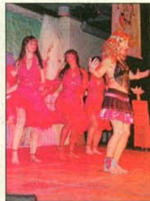
„Shakira“ wurde begleitet von den RCC-Tänzerinnen.