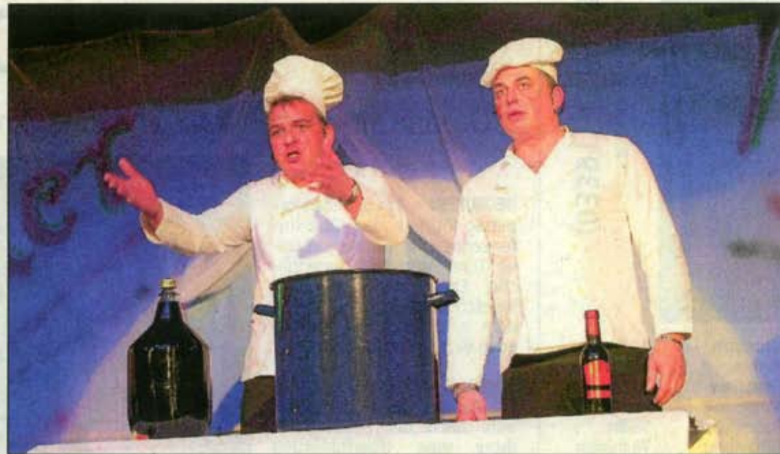
Im Kochstudio „K & K“ kommen die Protagonisten mit nur wenigen Zutaten aus, die es allerdings in sich haben. Die Persiflage auf die vielen Kochshows im Fernsehen gefiel.