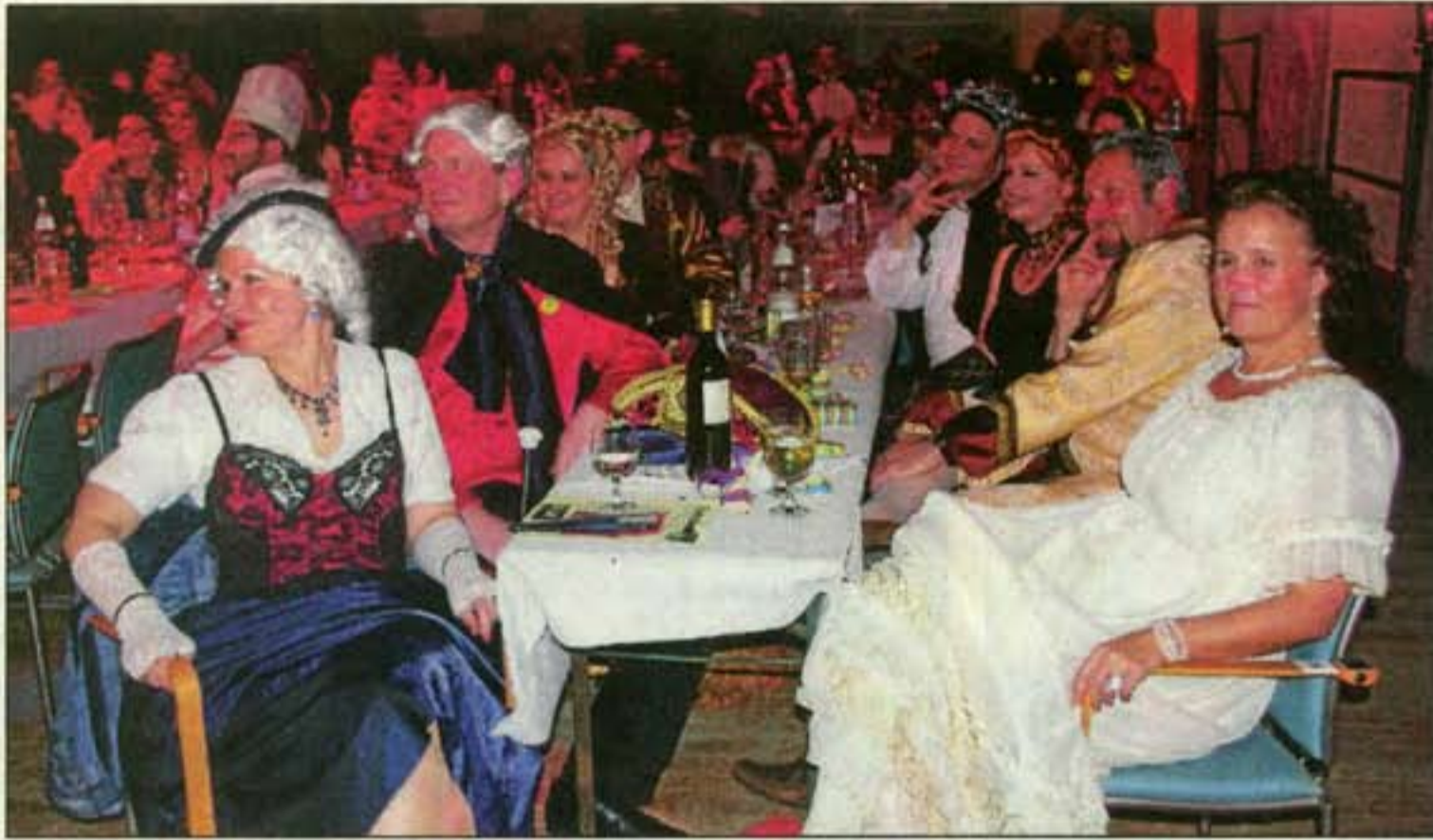
Natürlich war auch das Publikum kostümiert. Die Stimmung im Saal war ausgezeichnet, denn die Narren mit ihrem komischen Fernsehprogramm hatten es echt drauf.